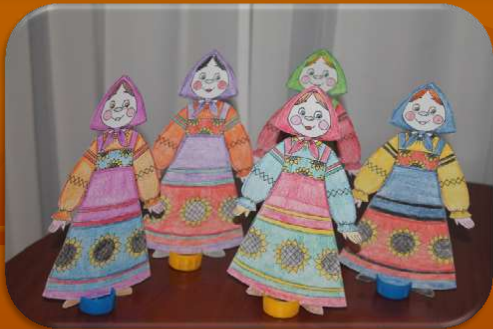
«Веселые подружки» (ср.гр.)